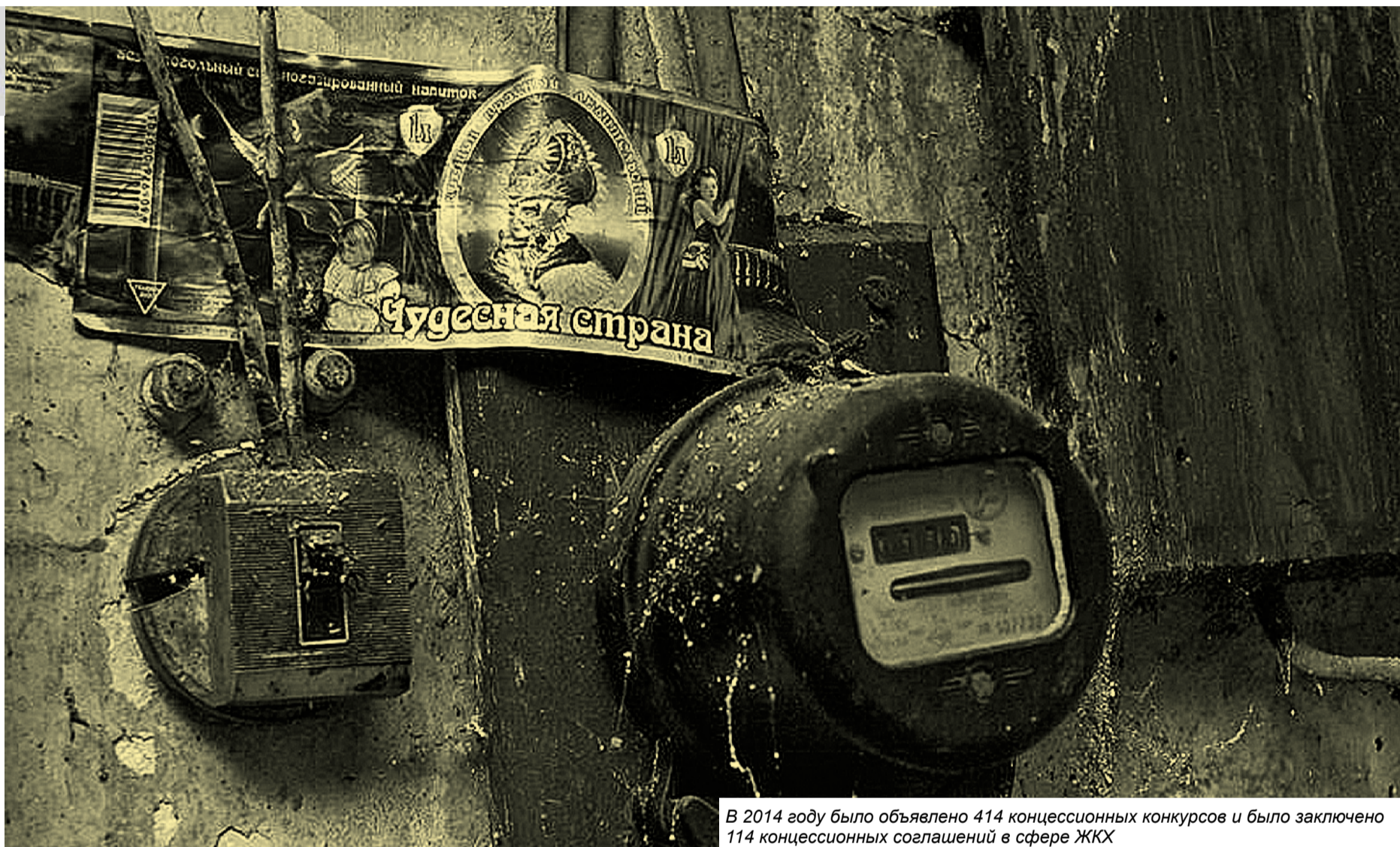
В 2014 году было объявлено 414 концессионных конкурсов и было заключено 114 концессионных соглашений в сфере ЖКХ